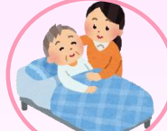
起床・就寝の介助