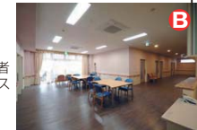
各ユニットには他の入居者様と歓談いただける共用スペースを設けています。