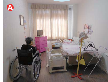
ベッド、洗面台、クローゼットが揃ったそれぞれの個室は、整理ダンスやテレビなどお好きな家具・家電を持ち込んでいただき、自由にレイアウトしていただくことが可能です。

入居者定員29名の当施設は完全個室になっています。テレビやテーブルなどご入居者様一人ひとりが自由にレイアウトしていただけます。