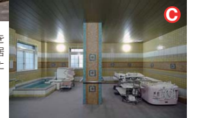
浴室には最新の入浴設備を設置、ハンディのあるご入居様にも安全に入浴していただけます。