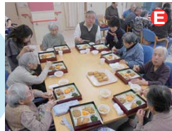
お花見行事の後、参加していただいたご家族と一緒に会食を楽しみました。