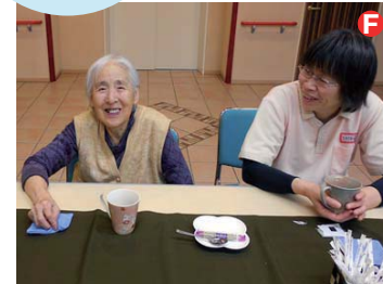
ロビーには、気軽に喫茶を楽しめるカウンターを設け、ご入居様のお話をゆったりとした環境でお聞きしています。

笑町、幸町、福町の3つのグループで生活をしていただいています。職員もグループ毎に固定し、毎日おなじみの職員が寄り添います。