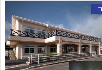
メインの通りから一歩入った静かな環境に立地しています。