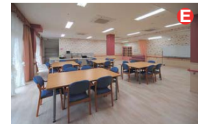
平日はデイサービスとして利用していただいているスペースは、敬老会や運動会など施設全体のイベントも開催しています。