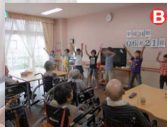
地元「桜花小学校」の皆さんとの交流会を開催。笑顔があふれました。