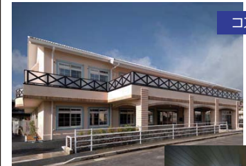
メインの通りから一歩入った静かな環境に立地しています。