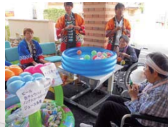
スイカ割り、風船釣りやわたあめの屋台も用意、夏祭りを開催しました。