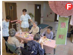
月に1回、お酒も用意して、希望される皆様のために居酒屋をオープンします。