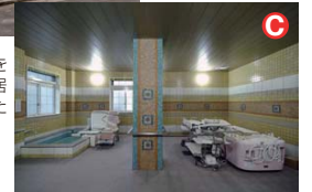
浴室には最新の入浴設備を設置、ハンディのあるご入居様にも安全に入浴していただけます。