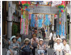
権堂アーケード商店街で七夕飾りの見学を行いました。