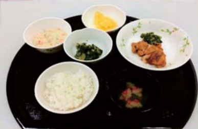
高齢者向けに工夫を凝らしたメニュー