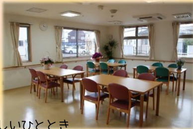
食堂で楽しいひととき