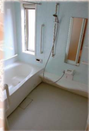
安全に配慮された浴室