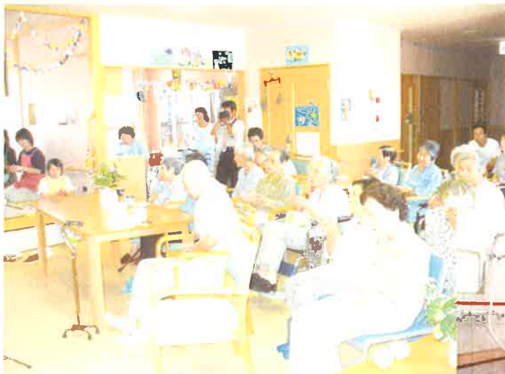
居間・食堂スペース (多目的に使われております)