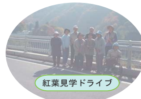
紅葉見学ドライブ