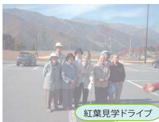
紅葉見学ドライブ