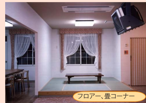
フローア、畳コーナー