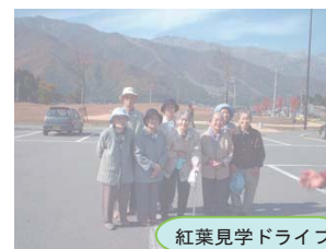
紅葉見学ドライブ