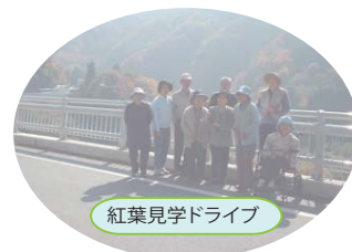
紅葉見学ドライブ