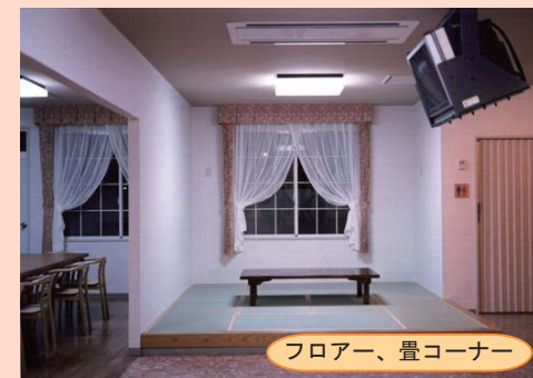
フロアー、畳コーナー