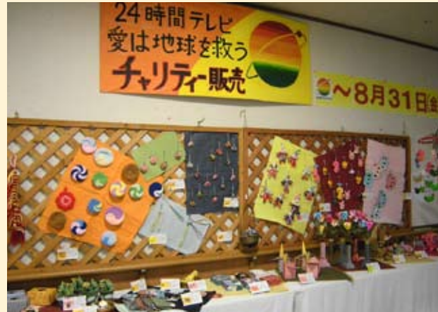
▲コスモスさいなみのエントランスホールにて行われたチャリティ販売。