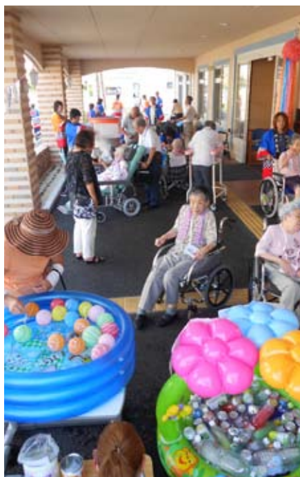
▲エントラントスペースには、スイカ割、ヨーヨー釣りのプール、綿菓子や焼きそばの出店が並び賑わいを見せる。

夏の暑さを吹飛ばすべく、8月3日にエントラントスペースを主会場に夏祭りを開催しました。ご入居の皆さん、デイサービス利用者の皆さん全員でのス