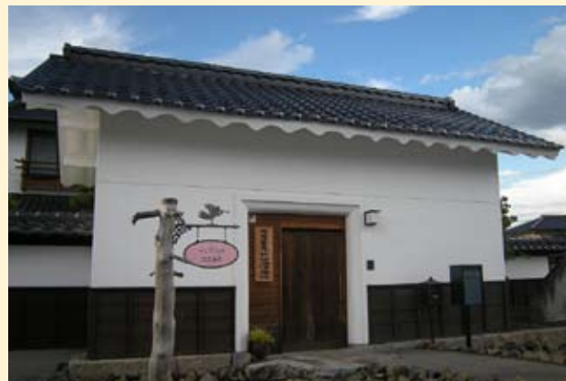
▲本物の蔵を改築して作られており、外観にも趣が感じられる。