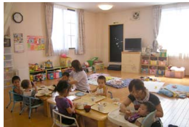
▲フローリングの明るい室内。2部屋に拡充された。