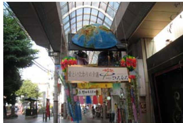
▲権堂アーケード街に展示された七夕飾り。