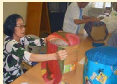
▲利用者様一人ひとりが製品作りに熱心に取り組まれていた。

さいなみ通所部門では、8月7日(火)31日(金)の間、24時間テレビチャリティ販売会を行いました。利用者様が作ったまごころもった作品を多数販売し、たくさんの方にご来場、ご購入頂きました。