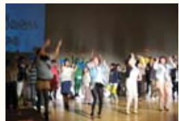
▲ダンスパフォーマンス