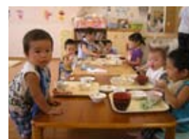
▲5人の保育士が所属し、好奇心旺盛な子どもたちの世話をします。

職場環境向上、少子化対策の一環としてコスモスさいなみの一角に設けられた保育所「たんぽぽ」が開設5年目を迎え、内外からの注目を集めています。3歳以下のお子さんが無料で利用できるうえ、職場に近いため母乳をあげられると職員にも好評です。現在10人の子どもたちが利用していますが、産休あけの職員も多く、さらに賑やかになる予定です。