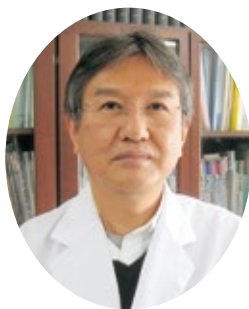
医療法人コスモス常務理事 医療法人コスモスライフ理事長