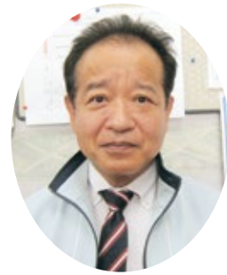
コスモス 法人 医療 長 務 事 長 福澤 浩

昨年こそコスモスでもワクチン接種を、行政に協力する形で、職員、利用者、外部の医療従事者、職員家族等に次々と行ってきました。