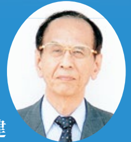
コスモスグループ会長 医療法人コスモス理事長