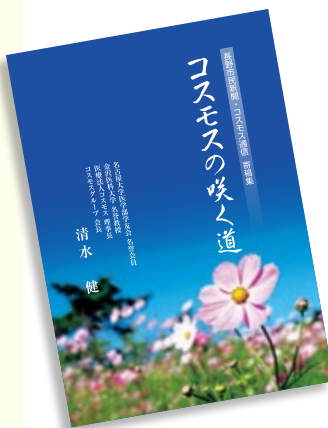
「コスモスの咲く道」 体裁：A5版、143ページ 製作・印刷・製本：トリニティ デザイン 発行：医療法人コスモス出版部