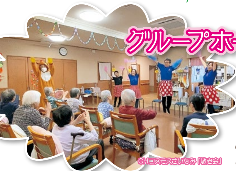
GHコスモスさいなみ「敬老会」

知っているようで知らないことの多い、グループ内の各施設の様子を紹介。今回は、グループ内で7つあるグループホーム（認知症対応型共同生活介護事業所）の紹介です。