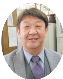
医療法人コスモス 事務部長